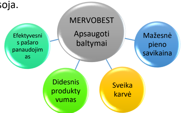
Apsaugotų baltymų kiekis sojų rupiniuose ir Mervobest Soy